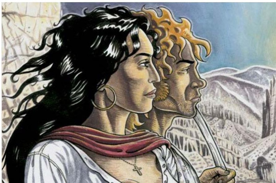
Meksikajnarji IIII - Sierra Madre