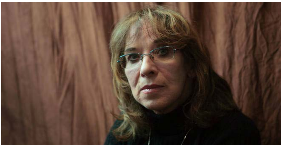
Svetlana Makarovič bo postala častna Ljubljanka

Kako? Pomislim da naj na leto 2020 v moji domovini? Mi je misel, da me morebiti kljub neštetim pokajenim cigaretam še niti do tega leta ne bo pobralo, zlovešča? Mi je misel, da bo strahovlada zabitosti, prostaškosti, požrtnosti, politične hinavščine in splošne duhovne plitkosti, zlovešča? Ja, zlovešča mi je, in srčno upam, da me takrat več ne bo, ker že sedaj zadosti težko diham v zatohlem ozračju naroda, ki se nezadržno razkraja. Ker se razkraja njegov jezik. Ker se razkraja njegova kulturna dediščina, ki ga je doslej vsaj kolikor toliko določala in s tem vzdrževala tudi narodno zavest.