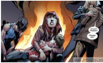
Spider-Man umre v objemu svoje ljubljene Mary Jane.

" Ne bom lagal, čeprav mi je nerodno priznati - po licih so mi tekle solze. "