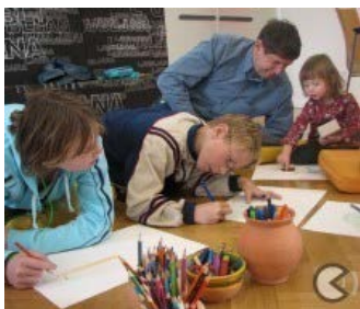
Risba v stripu - Narišimo si strip!