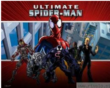
Serija Ultimate prinaša prenovljene ali malo drugače zastavljene različice slavnih Marvelovih junakov, poleg Spider-Mana še Može X, Maščevalce in Fantastične štiri. Junaki imajo tu drugačne zgodbe o genezi in manj zapletene preteklosti kot njihovi izvirniki. Foto: Marvel

Vir: http://www.rtvsl.si/kultura/knjige/ubili-so-spider-mana/260636