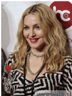
Madonna snema svoj novi, že 12. album. Foto: EPA

Vir: http://www.rtvsl.si/zabava/zanimivosti/madonna-kot-stripovska-junakinja/260659