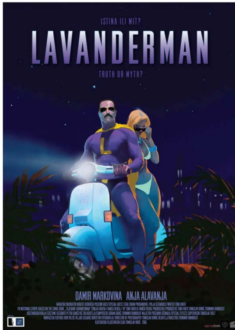
Plakat: Esad T. Ribić

V sklopu Pula film festivala - vhod prost.